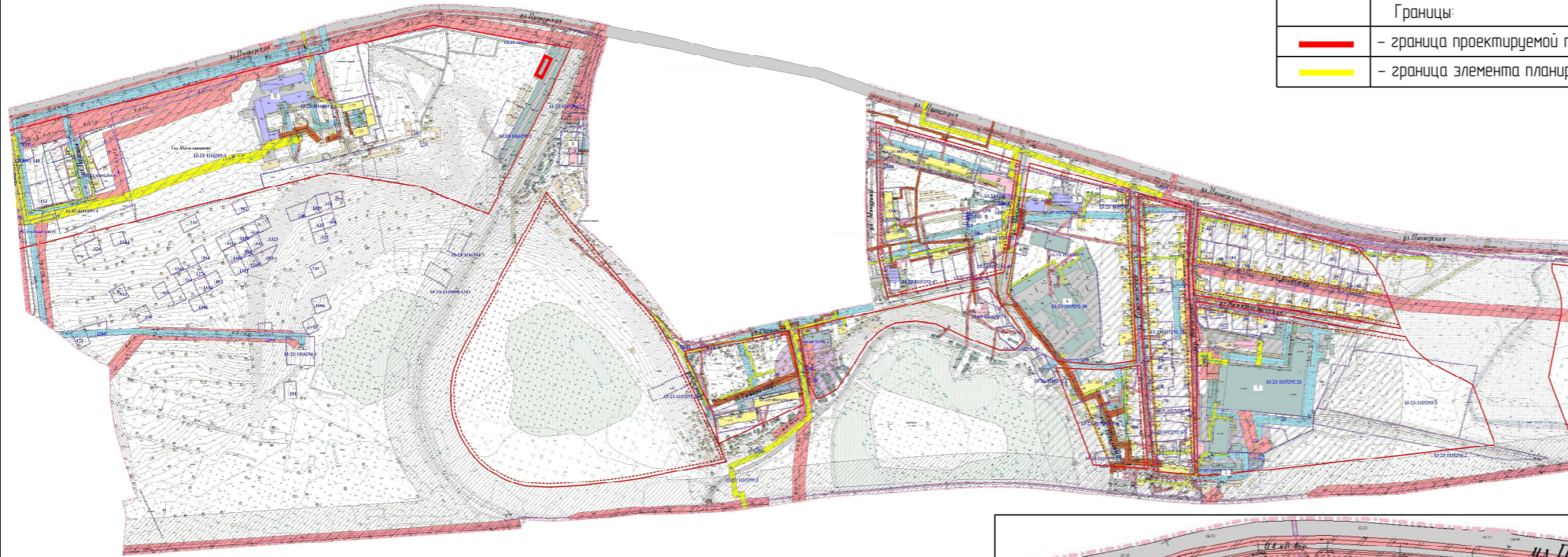
Схема расположения проектируемой территории в системе ранее разработанного проекта межевания территории