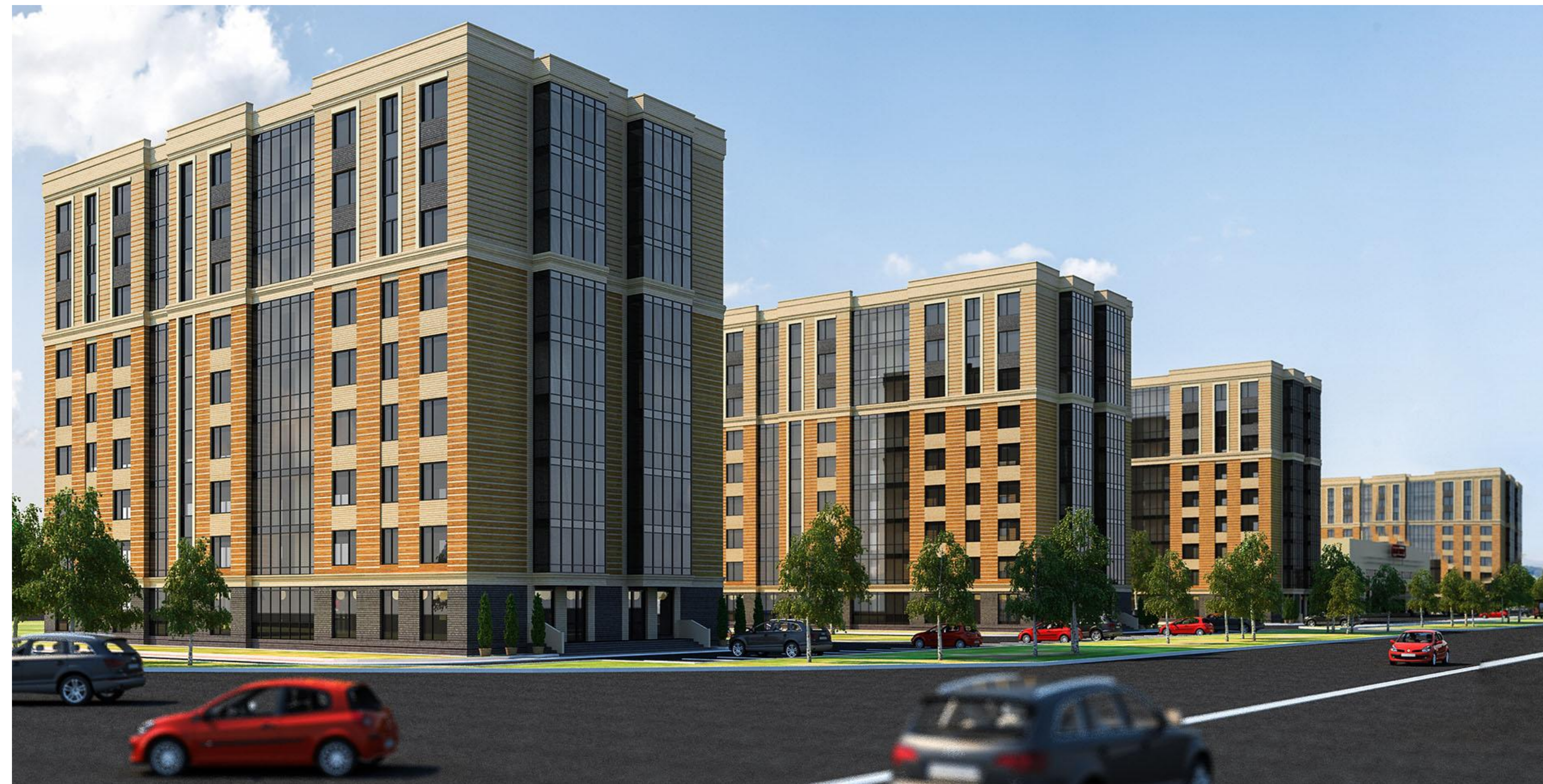
Общий вид здания